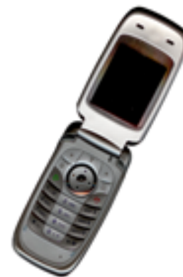
Gambar 2. Contoh gambar dengan resolusi kurang

Keterangan gambar diletakkan di bagian bawah gambar. Keterangan gambar menggunakan 8 pt Regular font dan diberi nomor dengan menggunakan angka Arab. Keterangan gambar dalam satu baris (misalnya Gambar 2) diletakkan di tengah ( centered ), sedangkan keterangan gambar yang lebih dari satu baris harus dirata kiri (misalnya Gambar 1). Keterangan gambar dengan nomor gambar harus ditempatkan sesuai dengan poin-poin yang relevan, seperti ditunjukkan pada Gambar 1 – 3, kecuali jika gambar berukuran besar melebihi satu kolom.