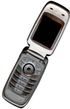
Gambar 3. Contoh gambar dengan resolusi cukup